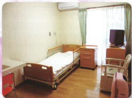
冷暖房・テレビ完備の 明るい居室