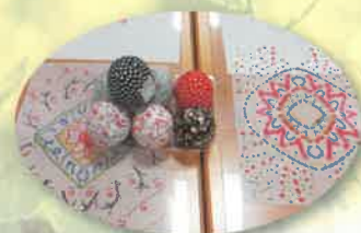
皆で楽しく過ごすつどいルーム