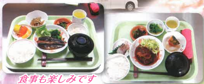
食事も楽しみです