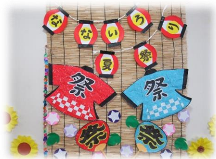
夏祭り(魚つりゲーム)