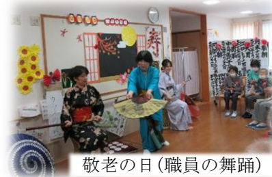
敬老の日(職員の舞踊)