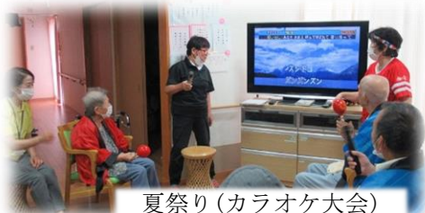
夏祭り(カラオケ大会)