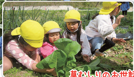
草むしりのお世話