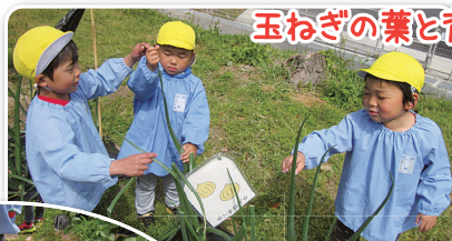
玉ねぎの葉と背比べ