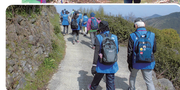
3月9日(土) 嬉野市にて