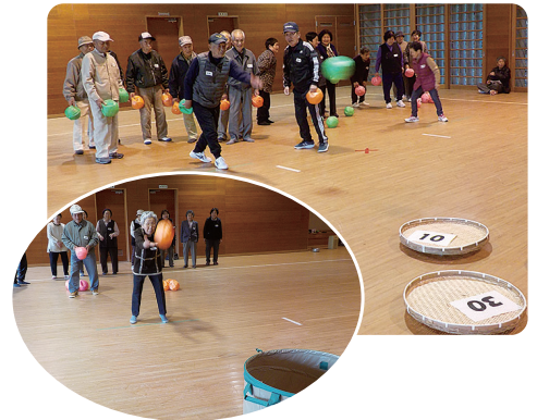
3月8日(金) 肥前武道場にて