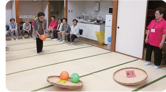
昨年の様子 唐津市ひれふりランド(浜玉町)にて