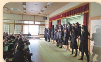
☆歳末チャリティーフェスタ(浜玉)