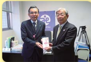
からつ杉の子会 YC サークル