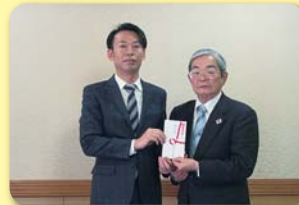
唐津地区遊技業組合