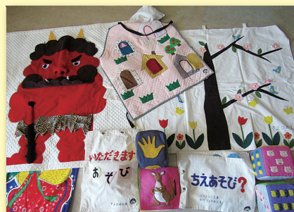
▲貸出おもちゃの一部