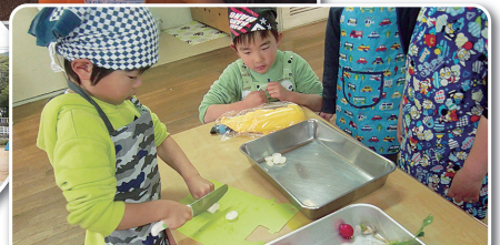
ほうれんそうや赤・白はつか大根 種まきから調理までしました。