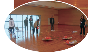
11月15日(木) 呼子町スポーツセンターにて