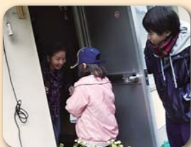
☆歳末交流事業(相知)