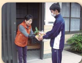
☆歳末ふれあい交流事業(北波多)