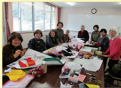
◀さよひめ文庫メンバーのみなさん