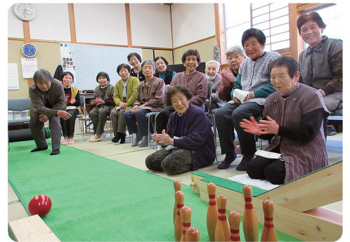
1月16日(水) ふれあい館にて