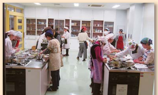
唐津南高の生徒さんに手伝っていただいています。

外出するきっかけづくりとして、食を通じた交流を年2回行っています。視覚に障がいのある方でも簡単に作れるメニューを採り入れています。