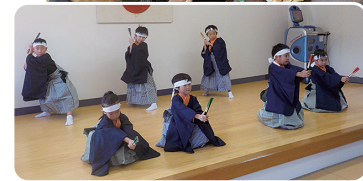
12月19日(水) 肥前町福祉センターにて