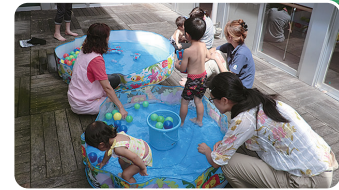
巖木町保健センターにて