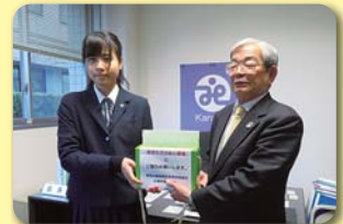
唐津西高インターアクトクラブ

(社)裏千家淡交会唐津支部 鏡校区社会福祉協議会 唐津市ボウリング協会 からつ杉の子会YCサークル 唐津地区遊技業組合