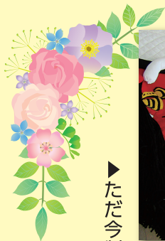
▶ただ今制作中の曳山

手作りおもちゃや布絵本などの色々な作品の無料貸し出しもしていますので見に来てください。布で作ったおもちゃや絵本なので、小さなお子さんにも安全に遊んでもらえます。