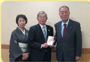
裏千家淡交会唐津支部