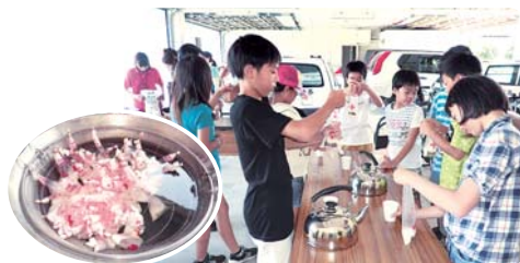
8月10日(金) 北波多公民館にて

地震・大雨等における日赤の救護活動の報告やハイゼックス(災害救援用炊飯袋)による災害食作り体験、応急手当を習いました。