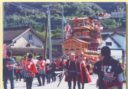
平成29年度 中島山笠祭の様子