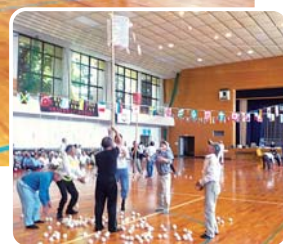
6月22日(金) 肥前体育館にて