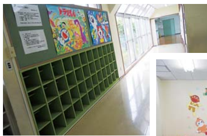
児童センターの様子

幼児連れの方がいろんな地域から遊びに来られ、「自由に遊べていいですね～」と嬉しい声も♪ 子育ての情報交換の場として利用されています。