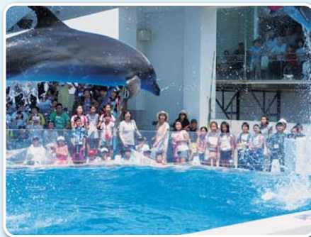
海きららでの様子

唐津市社会福祉協議会では、みなさまからの募金でいろいろな事業を行っています。今年も 10月1日 から共同募金運動が始まります。ご協力よろしくお願いします。