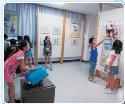
星きらりでの様子