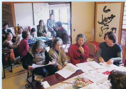
数字探し、ビーズ運び