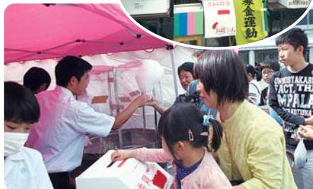
昨年の様子 平成29年10月1日(日) 七山市民センター前広場にて