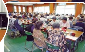
7月5日(木) 鎮西公民館にて