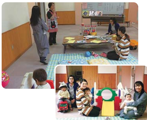
4月25日(水) 巖木保健センターにて

このサロンで悩みを共有し、子育てに積極的に取り組んでもらえるようスタッフ同心がけています。また、気兼ねなく参加できるように、毎月の内容も工夫しています。心地良い時間をみんなで過ごしてみませんか。