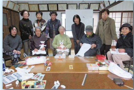
軍手でぬいぐるみを作ろう