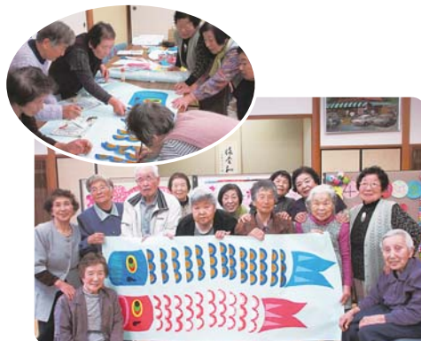
4月25日(水) ふれあい館にて

レクリエーションのひとつで4月には『こいのぼり』を利用者みなさんと作成しました。ひとりずつ作った部分が最後に大きな鯉になると「わあ!!」と歓声が上がりました。