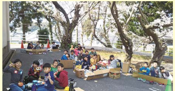
外町放課後児童クラブ▶