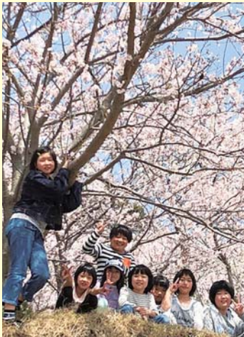
▲湊放課後児童クラブ

いつもと違う場所で食べるお弁当はとてもおいしく、男の子も女の子も仲良く一緒にシートを並べてお弁当を食べていました。