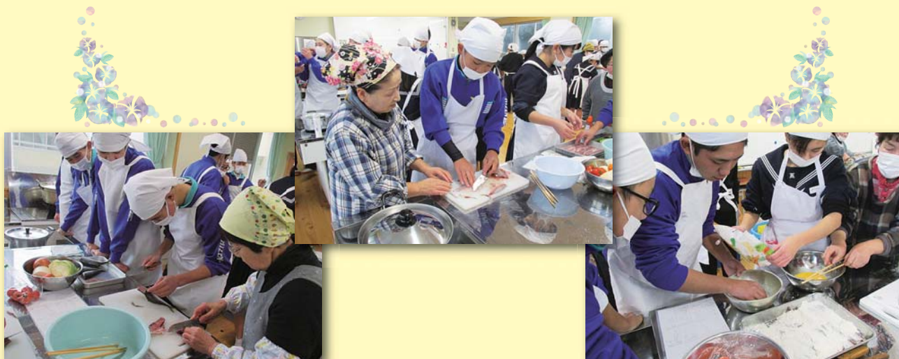
平成 29 年度肥前中学校 3 年生とのふれあい食育の様子

産業祭、食育活動などではもう少し手伝いをしてくれる人がいたら助かります。肥前公民館だよりに活動の日程などを載せますので女性の参加協力をお待ちしています。あと中学生の魚さばきを親御さんたちにも見てもらいたいので見に来てくれたら嬉しいです。