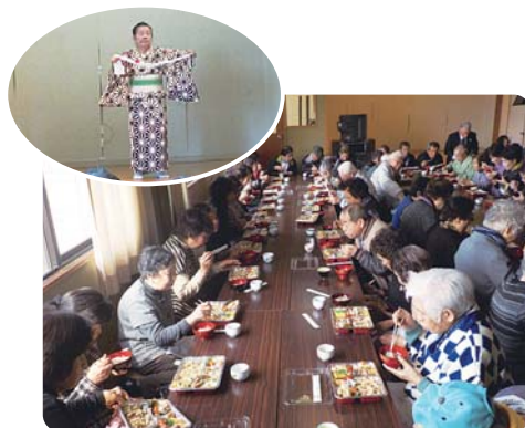
2月23日(金) 肥前公民館にて