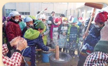
☆歳末餅つき事業（呼子・鎮西）