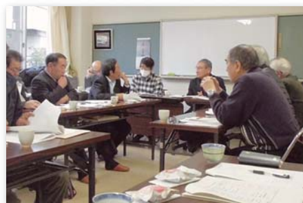
1月22日（月）東唐津公民館にて

地区（校区）社協では、地域をよくしていくため、助け合いの輪を広げていくために日頃より様々な活動に取り組まれています。