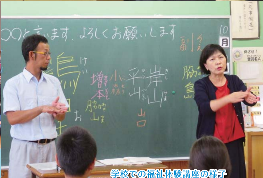
学校での福祉体験講座の様子