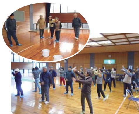
12月11日(月) 旧打上中学校武道館にて

レクリエーション大会は初めての試みでしたが、身近な道具を使って、サロンをより楽しく行うためのコツを学んでもらうことができました。