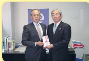
からつ杉の子会 YC サークル

唐津東ロータリークラブ からつ杉の子会YCサークル 唐津臨済宗青年僧 唐津西高等学校インターアクトクラブ 唐津地区遊技業組合