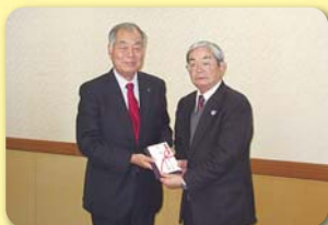
裏千家淡交会唐津支部

唐津市ボウリング協会 曹洞宗唐松伊青社会 社 茶道裏千家淡交会唐津支部 大聖院 鏡校区社会福祉協議会