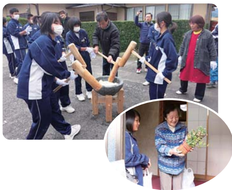
12月26日(火) 北波多地区にて

毎年の訪問を楽しみにしている方も多く、「寒さが厳しいので、風邪をひかれないように。良いお年をお迎えください」との声かけに「ありがとう」と笑顔いっぱいに応えられていました。