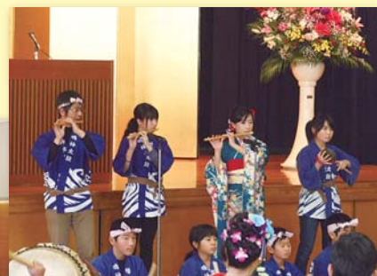
1月に行われた七山の成人式での演奏の様子