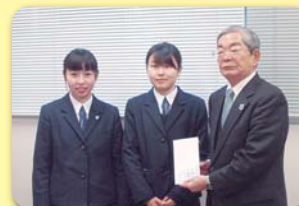
唐津西高インターアクトクラブ