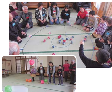
1月20日(土) 老人憩の家賀寿苑にて