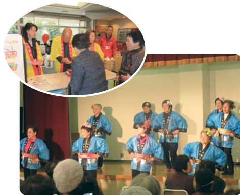
12月10日(日) ひれふりランドにて