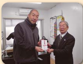
☆市内児童施設への寄付