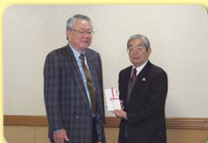
唐津地区遊技業組合

唐津市ボウリング協会 曹洞宗唐松伊青社会 社 茶道裏千家淡交会唐津支部 大聖院 鏡校区社会福祉協議会