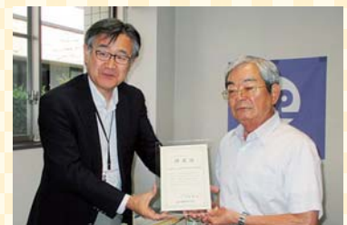
「がばい健康企業宣言」優良事業所の認定書交付式の様子▲

今後も職員が健康に働ける活気ある職場となるよう引き続き努力し、地域のみなさま並びに施設利用者のみなさまに元気をお届けしていきます。