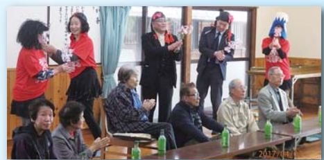
踊っておもてなし