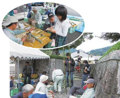
10月1日(日) 七山産業まつり会場にて

一緒に作った竹とんぼ、青竹踏み、竹馬などを大事そうに抱えて帰る子どもたちの姿が会場のあちらこちらに見受けられました。