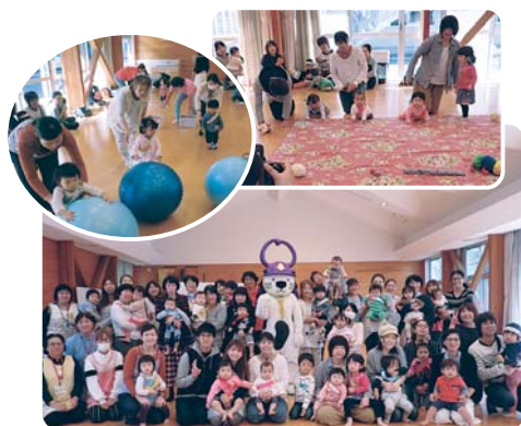
10月25日(水) 巖木町保健センターにて

巖木支所では、毎月第4水曜日に巖木町保健センターにおいて遊びを中心とした子育てサロンを実施していますので、ぜひ参加ください。