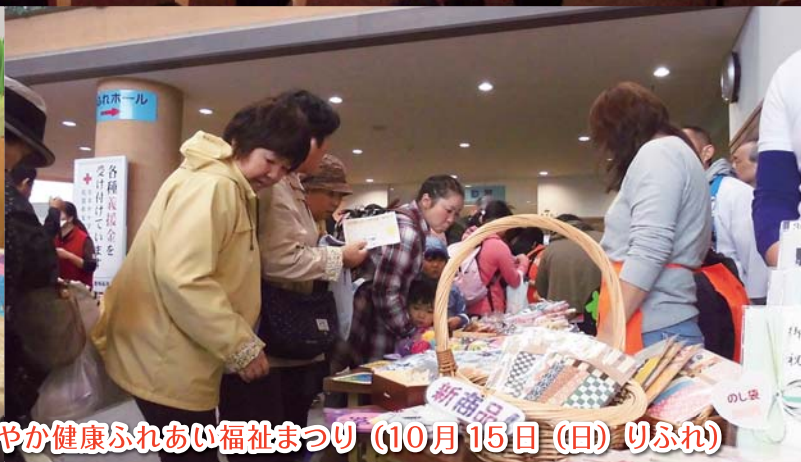
第31回 唐津市すこやか健康ふれあい福祉まつり (10月15日(日) 日ふれ)