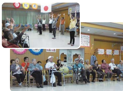
9月26日(火) ひぜん荘にて

家に帰って、家族に「今日は歌手が来たよ〜！」と話した利用者の方もたくさんいたそうです。