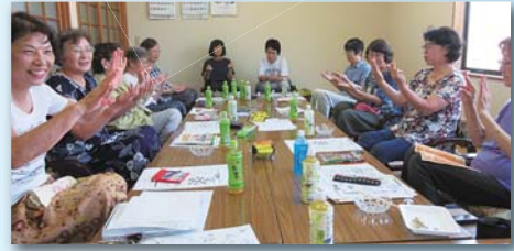
音楽に合わせて歌と踊り