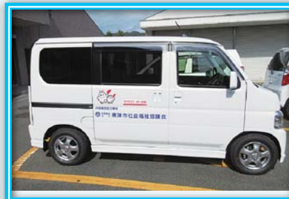
購入した赤い羽根共同募金配分車両（七山・浜玉支所）