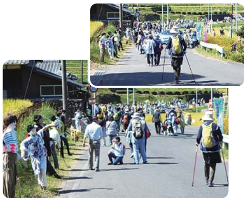
9月30日(土) 長崎県波佐見町にて

帰りのバスでは、「久しぶりにこやん歩いたよー」「やっぱり普段から歩かないかんね」などの話で盛り上がり、改めて健康について考える機会になりました。