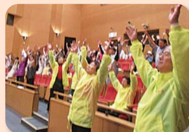
メインプログラムの笑いヨガでホールは笑いとお熱気にあふれました