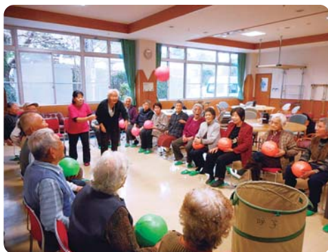
呼子町高齢者福祉センターにて