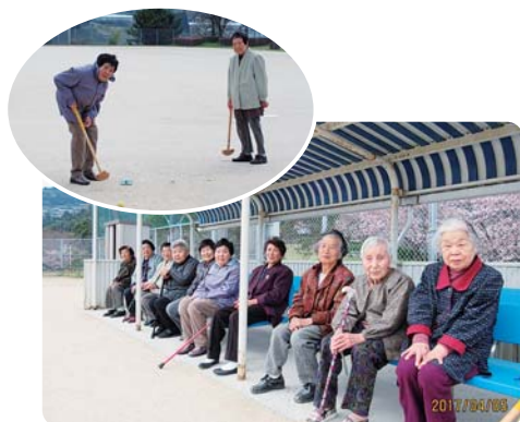
4月5日(金) 鳴神の丘運動公園にて

「ホールインワンになるかな?」と思いを込めて… 「あらんとこへ行ってしようたね～」とか「良かとこに打ったね～」など笑い声に包まれました。