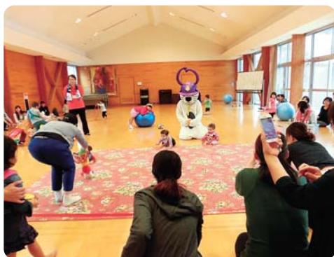
巖木町保健センターにて

サロンの参加者同士で子育てに関する悩みなどを話しながら、親子で心地よい時間を過ごしてみませんか～