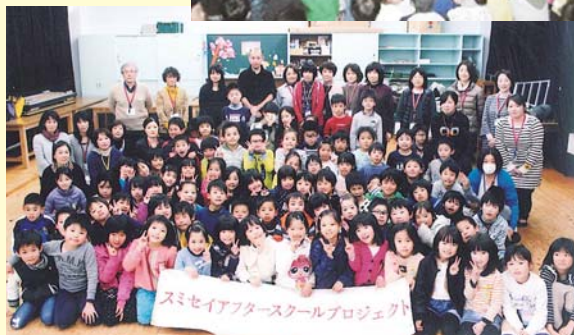
集合写真と講演の様子