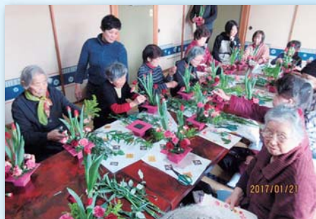
フラワーアレンジメント