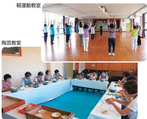
北波多公民館にて