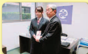
からつ杉の子会 YC サークル