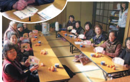
1月12日(木) 打上区公民館にて