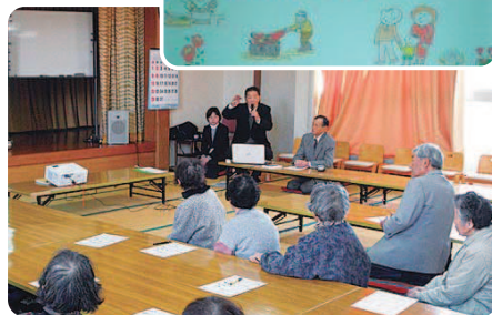
1月17日(火) 老人憩の家賀寿苑にて