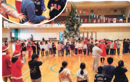
12月23日(金) 肥前総合体育館にて