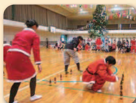
☆サンタと遊ぼう クリスマスパティー(肥前)

○お問い合わせ先○ 共同募金会唐津市支会 ☎(0955) - 70 - 2334