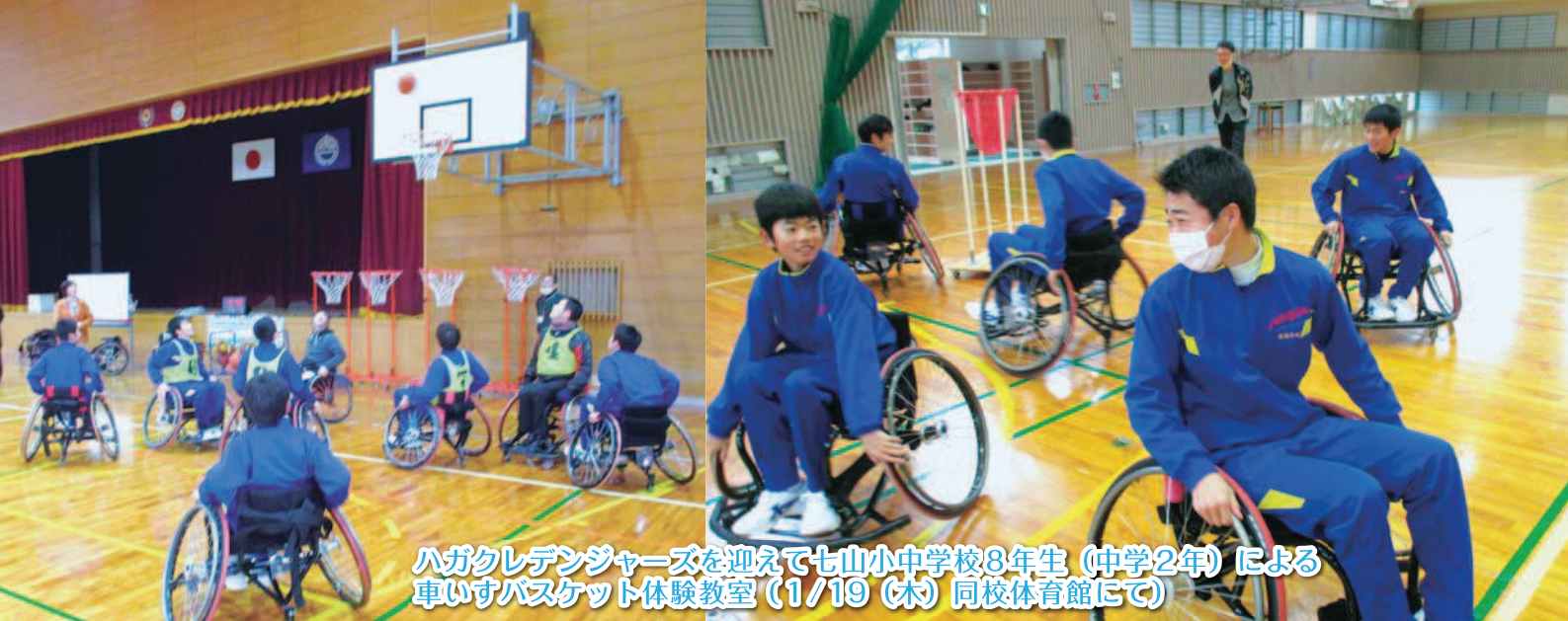
ハガクレデンジャーズを迎えて七山小中学校8年生(中学2年)による車いすバスケット体験教室(1/19(木)同校体育館にて)