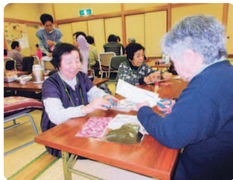
12月9日(金) 佐用姫の湯にて

「かわいらしかね～。こやんかとのできたよ。」 「ちょっと待って～型紙切りよるけん。」と声をかけあって楽しんで作られました。