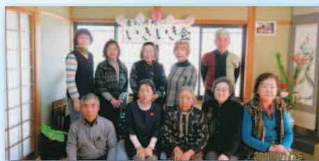
いきいき会の仲間

特徴等 平成21年9月に発足し、1度も欠かさず、毎月サロンを行っています。サロンを通じて、健康維持だけでなく、町内の人との繋がりを築いています。ゲームの道具はほぼ手作りです！