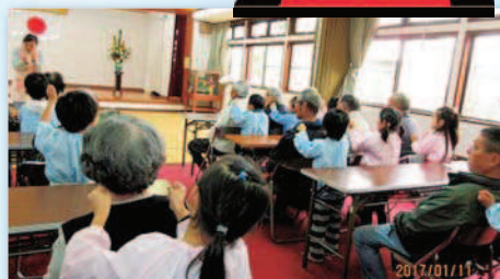
園児による肩たたき

特徴等 駐在員、民生児童委員、福祉員、婦人部が中心となり、サロンを通じて健康維持と仲間づくりを行っています。食事は、献立づくりから調理まで婦人部で行っています。