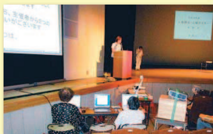
講演会での要約筆記の様子