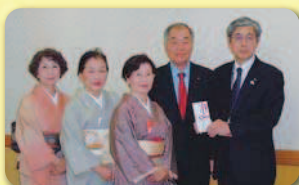
裏千家淡交会唐津支部