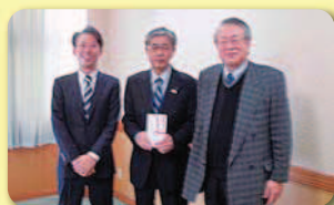
唐津地区遊技業組合