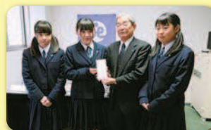
唐津西高インターアクトクラブ

相知町地域婦人会 大聖院 鏡校区社会福祉協議会 唐津市ボウリング協会 からつ杉の子YCサークル