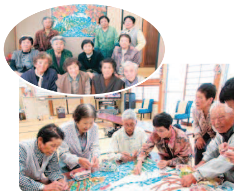
9月23日(金) ふれあい館にて

「どんぐらい色のついたやろうか?」とか「まだこんぐらいかな?」と声をかけ合ったりと会話もはずんでいました。