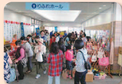
お目当ての品を求めて人だかりができました