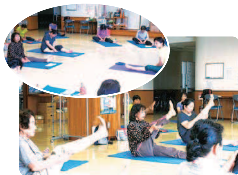
10月19日(水) 呼子町高齢者福祉センターにて