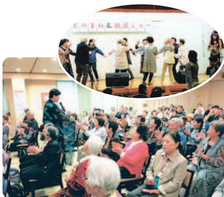
10月13日(木) 吉野ヶ里温泉にて

参加者談：家ではひとりだからこんなに笑ったりせんもんね。面白かったよ。一日楽しかった。