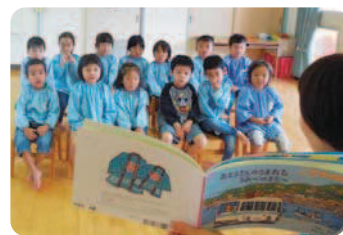
絵本の読み聞かせの様子