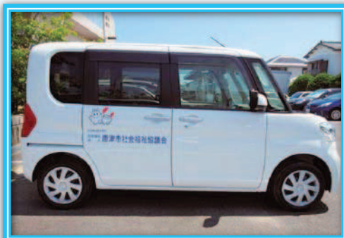
購入した赤い羽根共同募金配分車両