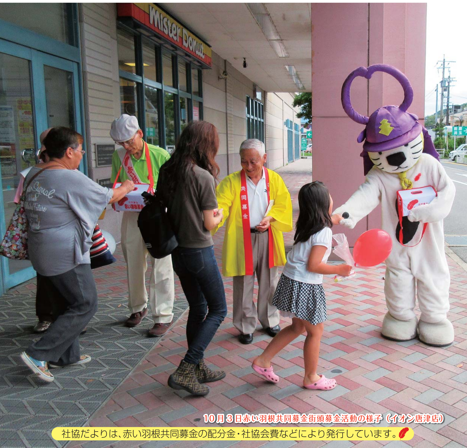
10月3日赤い羽根共同募金街頭募金活動の様子（イオン唐津店）