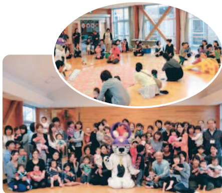
10月26日(水) 巖木町保健センターにて