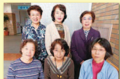
メンバーの皆さん