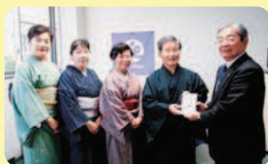
裏千家淡交会唐津支部