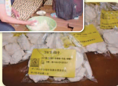
婦人会のメンバー中心に作った「ゴキブリ団子」