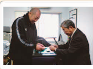
市内児童養護施設への寄附