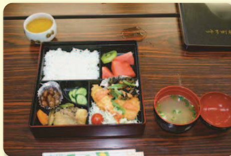
ボランティアによる調理の様子と食事