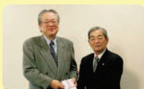
唐津地区遊技業組合