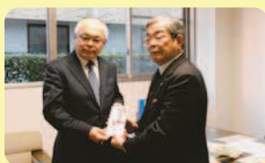
からつ杉の子会YCサークル