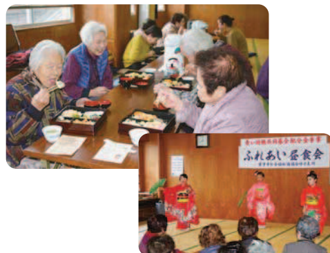
1月14日(水) 呼子公民館にて

参加者はお弁当を食べながらお隣の方と楽しくおしゃべりをし、元気に踊る園児の姿に目を細め、つかの間の楽しい時間を過ごされました。