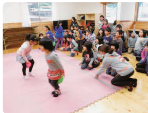
1月16日(金) 相知放課後児童クラブにて

ゲーム中、うまくいかなくてくやしがる子、高得点を出して笑顔いっぱいの子、応援する声で大賑わいでした。「みんなで楽しかった。また、しょうね」と声を揃えて話していました。