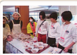
浜玉歳末たすけあいチャリティーショー