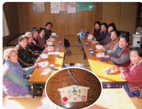
1月8日(木) 打上区公民館にて