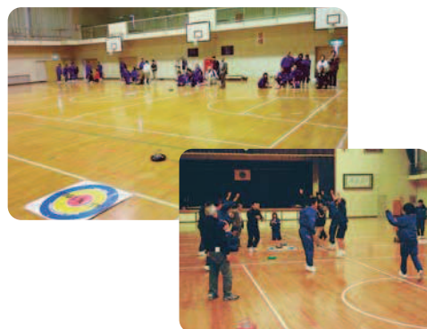
11月13日(木) 蔵木中学校体育館にて