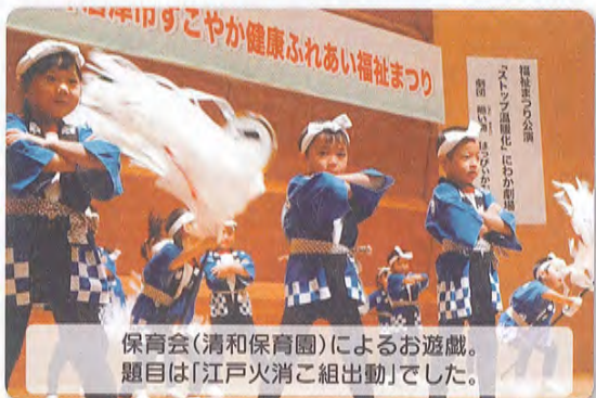
保育会（清和保育園）によるお遊戯。題目は「江戸火組組出動」でした。