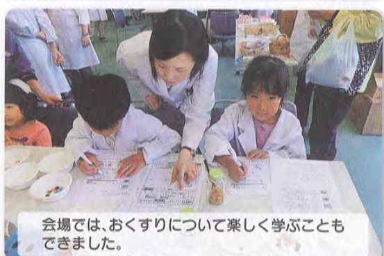
会場では、おくすりについて楽しく学ぶことができました。