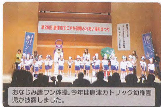
おなじみ唐ワン体操。今年は唐津カトリック幼稚園児が披露しました。