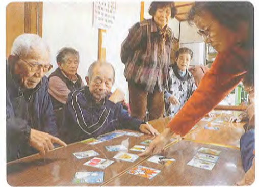
11月22日 棕の木公民館にて

サロンのもうひとつの楽しみは、手作りのお昼ご飯です。今回の献立は、冬瓜煮。和やかな時間が流れました。