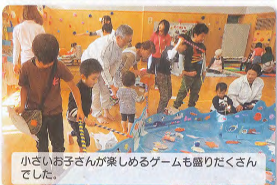
小さいお子さんが楽しめるゲームも盛りだくさんでした。