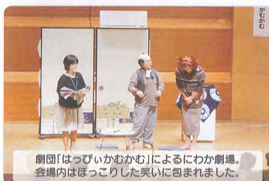
劇団「はっぴいかむかむ」によるにわか劇場。会場内はほっこりした笑いに包まれました。