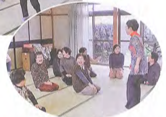
10月17日 北波多老人憩の家にて