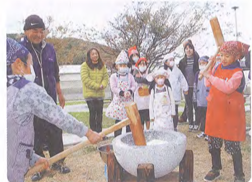
12月4日 小川島老人憩の家にて

また「いつまでもお元気に…」との思いを込めたメッセージカードを添えて地区内のひとり暮らし高齢者へ渡しました。