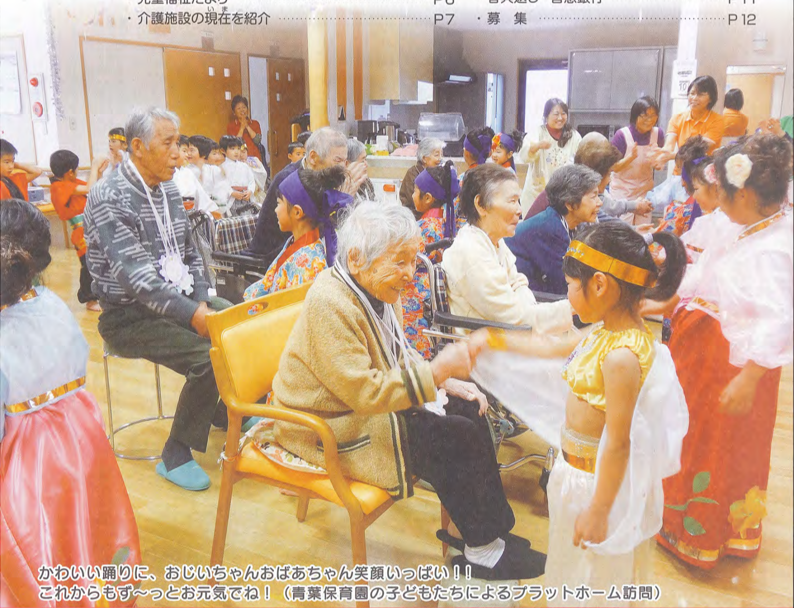
かわいい踊りに、おじいちゃんおばあちゃん笑顔いっぱい！！ これからもず〜っとお元気でね！（青葉保育園の子どもたちによるプラットホーム訪問）

発行 / 社会福祉法人 唐津市社会福祉協議会 〒847-0861 佐賀県唐津市ニタ子3丁目155-4 唐津市高齢者ふれあい会館りふれ内 TEL 0955-70-2333 FAX 0955-70-2338 URL http://www.karatsu-shakyo.or.jp/ E-mail rifure@trad.ocn.ne.jp