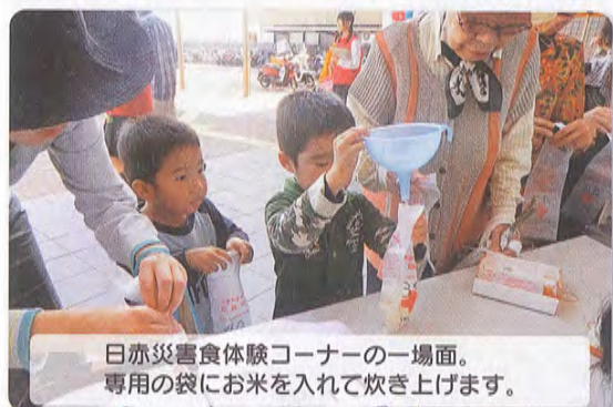
日赤災害食体験コーナーの一場面。専用の袋にお米を入れて炊き上げます。