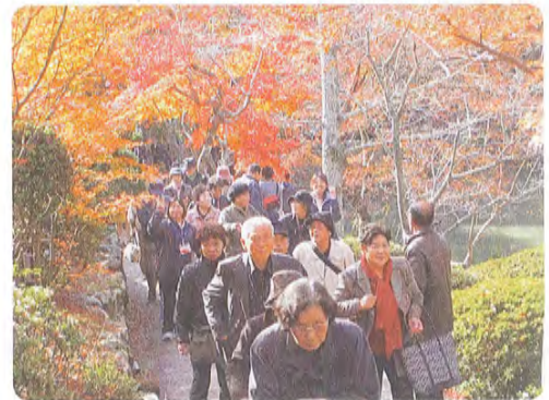
参加者と御船山楽園の紅葉