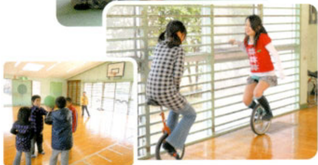
「将棋、一輪車、ボール遊びをしている子ども達」

保育士 「これ、なに色？」 子ども 「赤」 保育士 「これは？」 子ども 「青」 保育士が頭を指さして、 保育士 「これは？」 子ども 「帽子！」 保育士 「…」