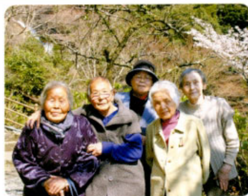
3月31日 見返りの滝にて

まだ少し肌寒さも残っていて、桜満開のお花見とはいきませんでした。さくらや木蓮などの木々の花と若葉、また菜の花やすい仙、すみれの草花が作り出す鮮やかな色どりに、春の訪れを感じることができました。