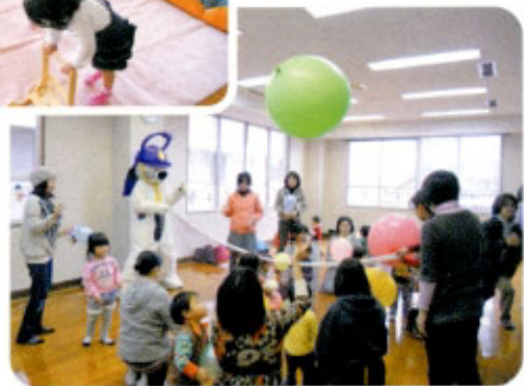
「唐ワンくんと楽しく遊ぶ幼児とお母さん」