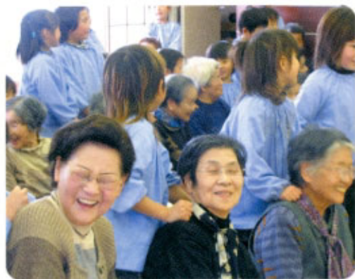
2月24日 ひれふりランドにて

参加者談:久しぶりに子どもたちと交流し、元気をもらって心身ともにリフレッシュできた～!!