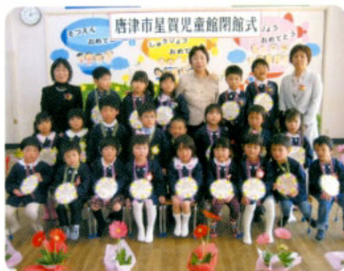
3月28日 星賀児童館にて