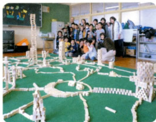
3月30日 巖木児童クラブにて

ひとりひとりが作った作品をつみきでつないでいくと、大きな町ができあがり、子どもたちは大満足でした。