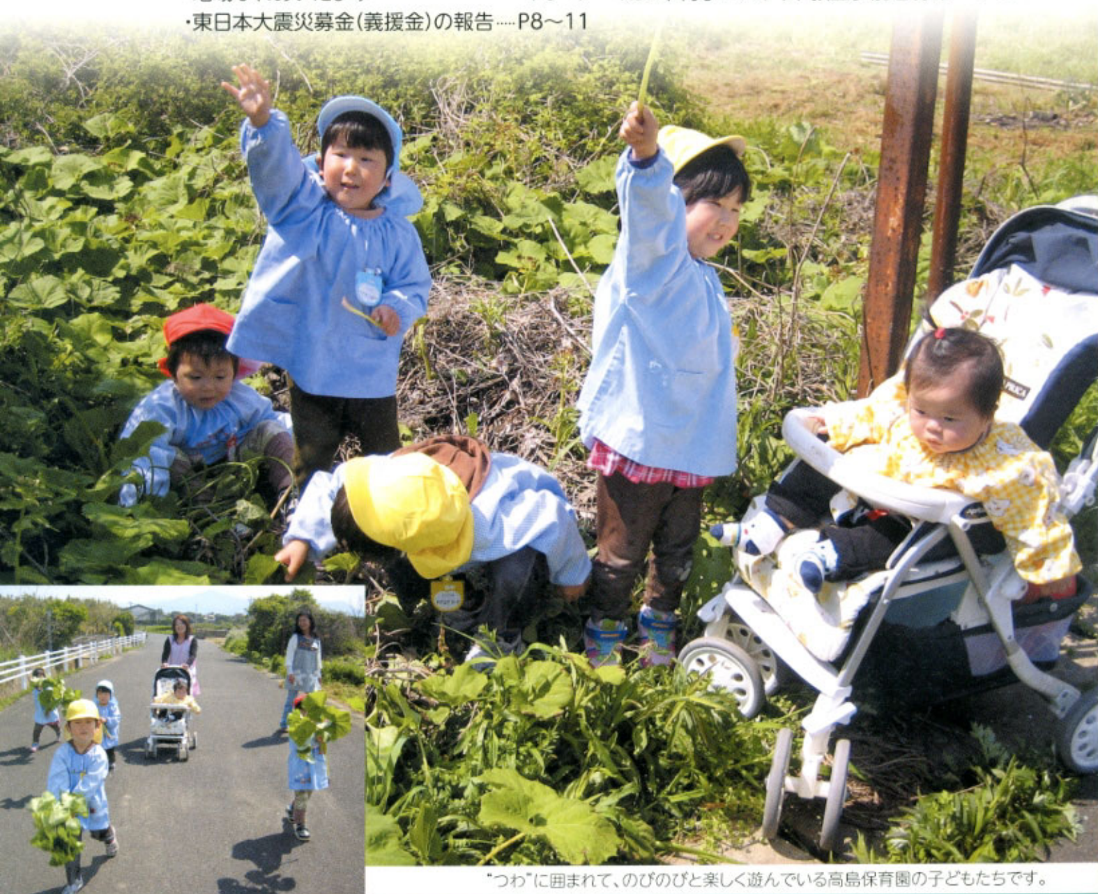
“つわ”に囲まれて、のびのびと楽しく遊んでいる高島保育園の子どもたちです。