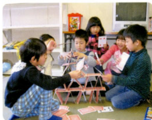
3月26日 打上中学校武道館にて