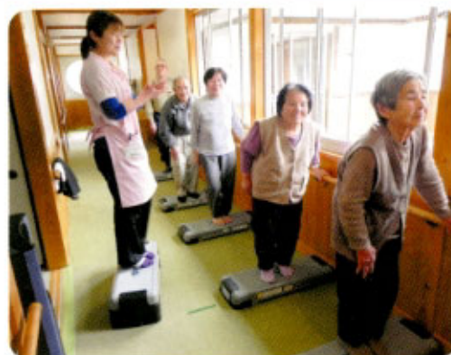
4月6日 ふれあい館にて

参加者談:「さあ登って降りてイチニーイチニ!」の掛け声で元気になりました。気のせいかもしれませんが、リズリズになったみたいです!