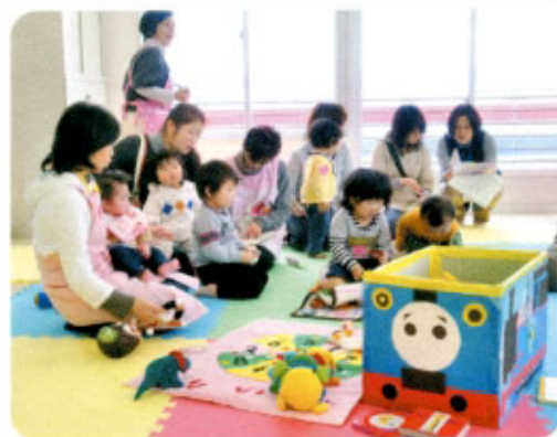
子育てサロンの様子