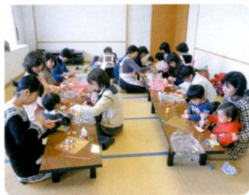
3月3日 相知町保健センターにて

5月19日はおしゃべり会で、子育ての悩み相談会。6月15日は生きがいディサービス「相知いきいき館」へボランティアに出掛けます。