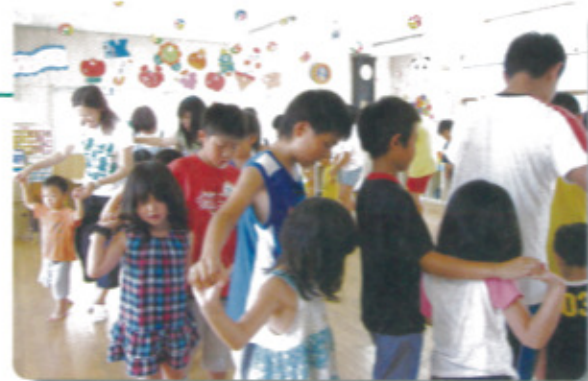
9月2日 竹木場児童館にて