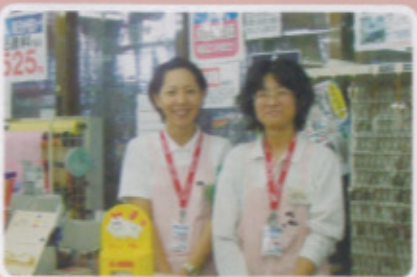
唐津地区 ナフコ唐津店