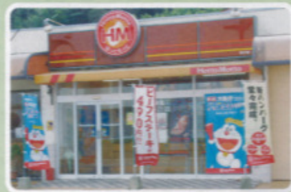
鏡校区 ほっともっと呼子店