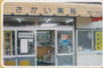
鏡校区 さかい薬局