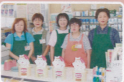
唐津地区 ひまわり東唐津店