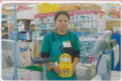
唐津地区 サンフレッシュ神田店