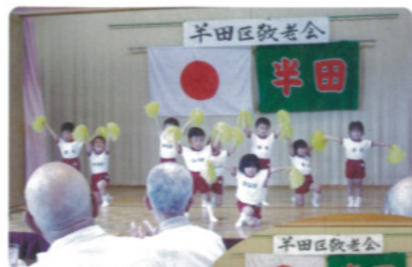
9月20日 半田児童館にて

年少児9名、年中児8名、年長児4名、計21名が「トイちゃんタラッタ」と「きのこ」を踊り、歌「ももたろう」をおじいちゃんおばあちゃんと一緒にうたい楽しい一日をすごしました。