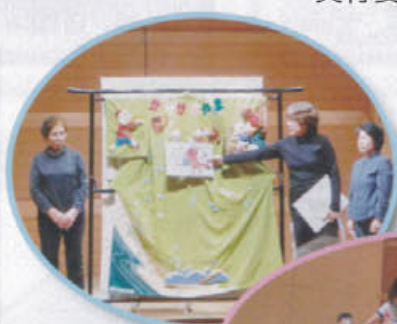
◀唐津市ボラ連さよひめ文庫 着物シアターの様子