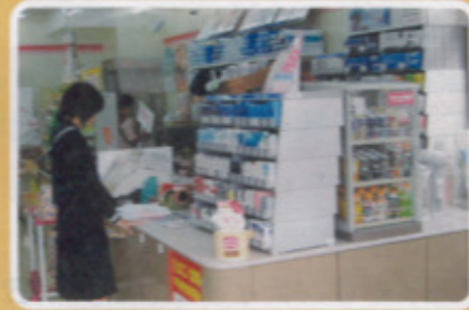
鏡校区 セブンイレブン鎮西店