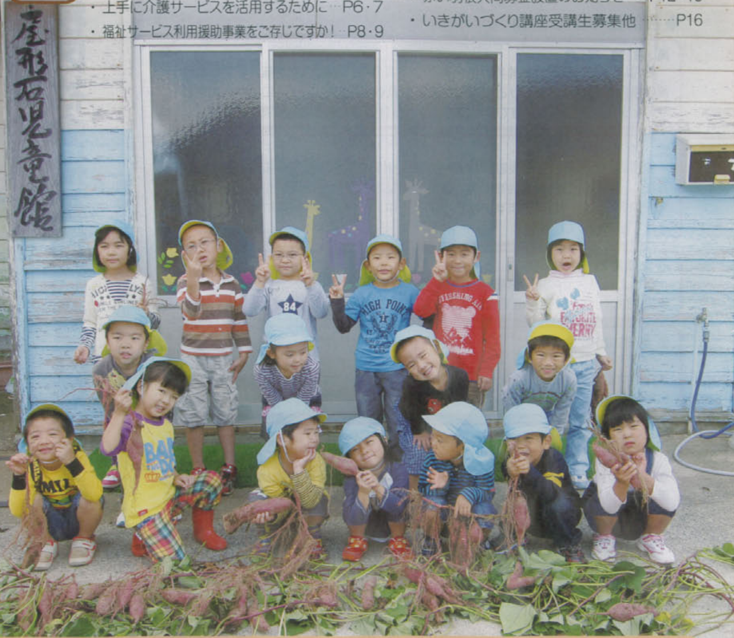
いろいろな形の「いも」をたくさん掘りあげ、大喜びしている屋形石児童館の子どもたちです。

発行 / 社会福祉法人 唐津市社会福祉協議会 〒847-0861 佐賀県唐津市二太子3丁目155-4 唐津市高齢者ふれあい会館りふれ内 TEL 0955-70-2333 FAX 0955-70-2338 URL http://www.karatsu-shakyo.or.jp/ E-mail rifure@trad.ocn.ne.jp