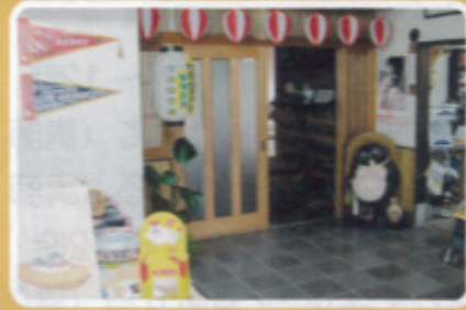
鏡校区 大手門食堂