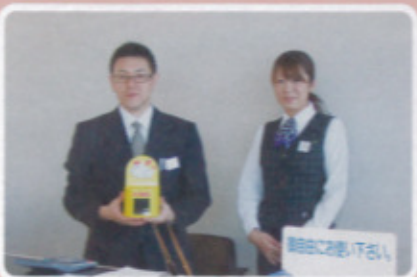
唐津地区 虹の松原ホテル