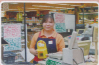
唐津地区 サンシティちかまつ