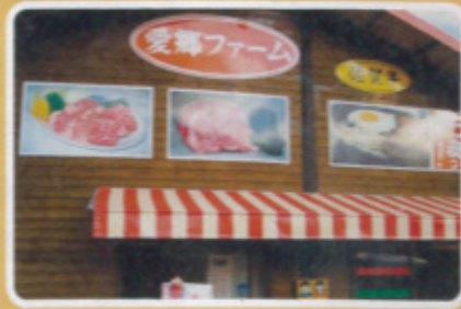
鏡校区 愛郷ファーム