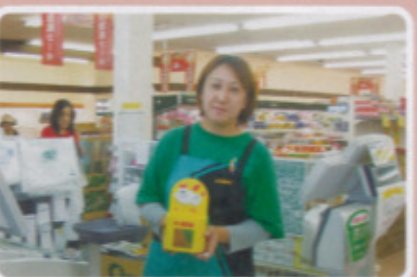
唐津地区 サンフレッシュ和多田店