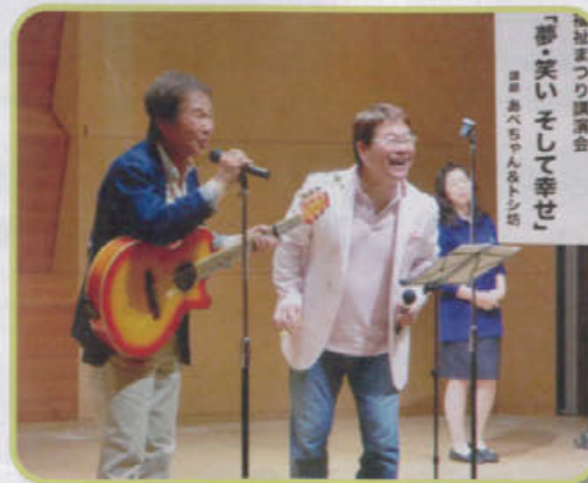
▲あべちゃん&トシ坊「夢・笑いそして幸せ」