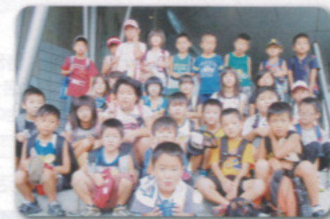
（8月30日 宇宙科学館にて）

8月30日（月）、敵木の児童クラブの子ども達が、夏休み行事の中で一番楽しみにしている「3クラブ合同のバス旅行」を実施しました。行き先は、県立宇宙科学館（武雄市）です。科学実験を楽しんだり、特別展の恐竜の化石にさわったり、持参のお弁当をおいしく味わったりで、子ども達は少々興奮ぎみでした。宇宙体験を無事終え、宿題の絵日記や、作文の題材もできあがりしました。