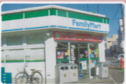
唐津地区 ファミリーマート市役所前店