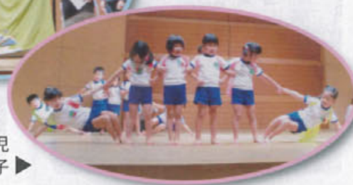
西唐津保育園園児 お遊戯の様子▶