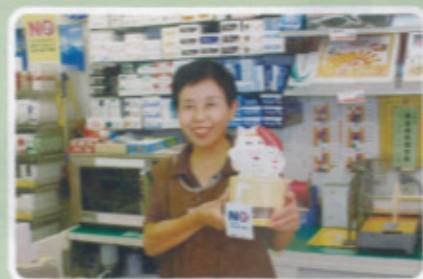
鏡校区 Yショップ呼子朝市通り店