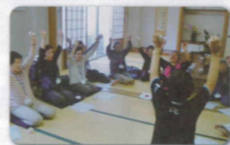
（飯木温泉「佐用姫の湯」にて）

北波多地区を8つのグループに分け、毎週木曜日に行っている介護予防教室は温泉施設を利用しています。血圧測定の後介護予防体操やレクリエーションなどで筋力の衰え予防や、脳の活性化に繋がる「ぬり絵や間違い探し」など、様々な趣向で参加者の皆さんは楽しく過ごされています。