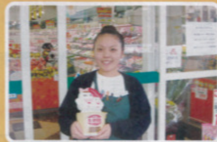
鏡校区 まいづるナイン鎮西店