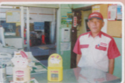
唐津地区 岩下商店