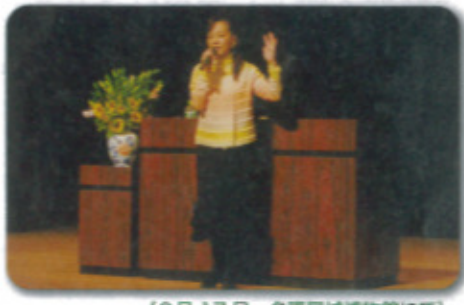
（9月17日 名護屋城博物館にて）

20年間の壮絶な介護を通して「家族」や「夫婦」で有り続ける事の大切さなど、笑いありまた時折涙を流しながら話されました。