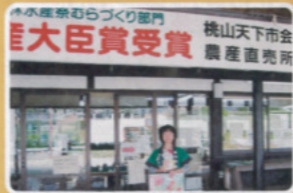
鏡校区 道の駅 桃山天下市