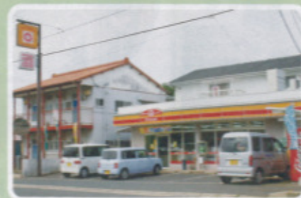
呼子区 Yショップふじまつ