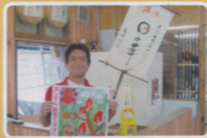
鏡校区 より道の駅 えん屋