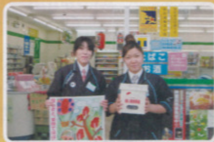
鏡校区 ファミリーマート岩野店