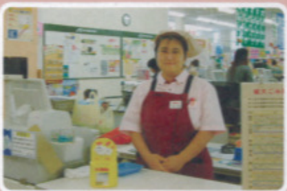
唐津地区 スーパーモリナガ唐津店