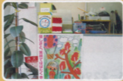
鏡校区 はらだ釣具店