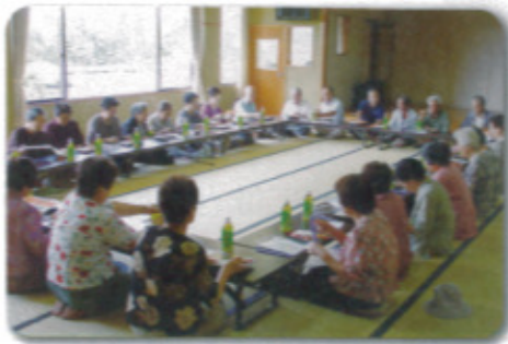
（9月14日 入野校区にて）

今年度、第2回目の食事会を校区ごとに開催しました。町内（納所農漁民センター、肥前公民館、高串児童館）にて食事会を行い総勢95名（民生委員含む）が参加され、食事後は鏡山、浜崎の諏訪神社へドライブに行きました。変わりゆく市内の風景を見ながら、昔話にも花が咲き、笑い声のたえない楽しい車内でした。ご協力いただいた民生委員さん、たいへんお疲れさまでした。