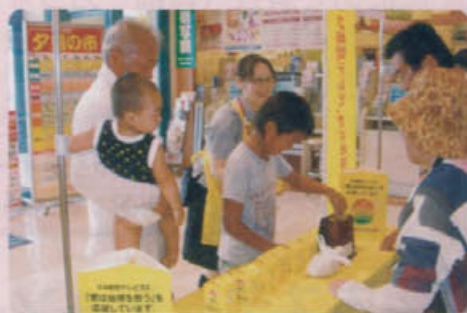
ジャスコ唐津店にて