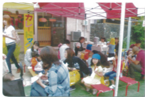
10月2日 外町保育園にて

人気のカレードック！ チーズ、牛乳、パセリ... 栄養満点、ボリュームたっぷり「おいしーい！サイコー！」