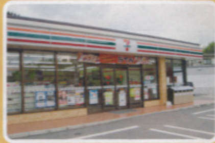
鏡校区 セブンイレブン加倉店