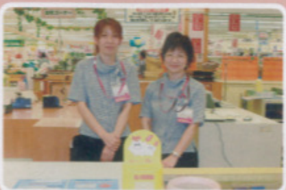
唐津地区 ジャスコ