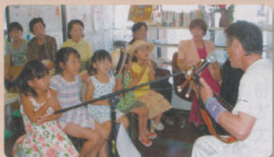
9月18日 お楽しみ会にて