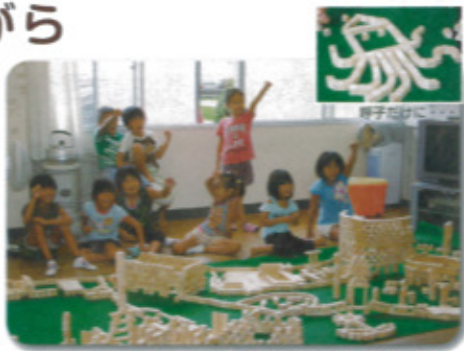
（9月11日 呼子放課後児童クラブにて）

呼子放課後児童クラブでは、佐賀県学童保育伊万里支援センターにご協力いただき、積み木遊びをしました。森林資源の大切さについて学んだあと、2400個の積み木を使って作品づくり。ひとりずつ作った作品を一つにつなげ、みんなで協力して大きな作品をつくりました。完成した時には、みんなの笑顔がいっぱいでした。