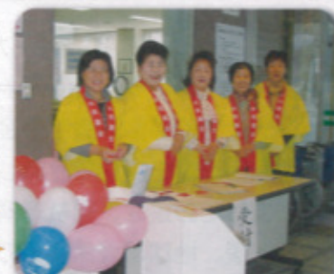
（昨年12月6日 ひれふりランドにて）