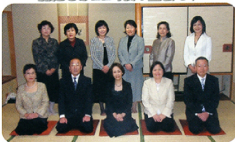
あけほの保育園・佐志保育園・外町保育園・くりのみ保育園・大島保育園・高島保育園 和多田保育園・町田保育園・青葉保育園・長松保育園・清和保育園