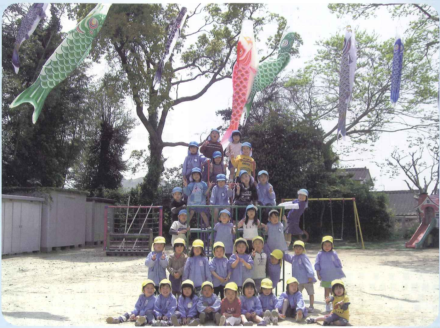
外町保育園の園児さん

発行/社会福祉法人 唐津市社会福祉協議会 〒847-0861 佐賀県唐津市ニタ子3丁目155-4 唐津市高齢者ふれあい会館りふれ内 TEL 70-2333 FAX 70-2338 E-mail rifure@trad.ocn.ne.jp ホームページ http://www.karatsu-shakyo.or.jp/ ● 浜玉支所 ☎56-6617 ● 磯木支所 ☎51-5051 ● 相知支所 ☎62-2602 ● 北波多支所 ☎64-3090 ● 肥前支所 ☎54-2838 ● 鎮西支所 ☎82-4985 ● 呼子支所 ☎82-5937 ● 七山支所 ☎58-2141