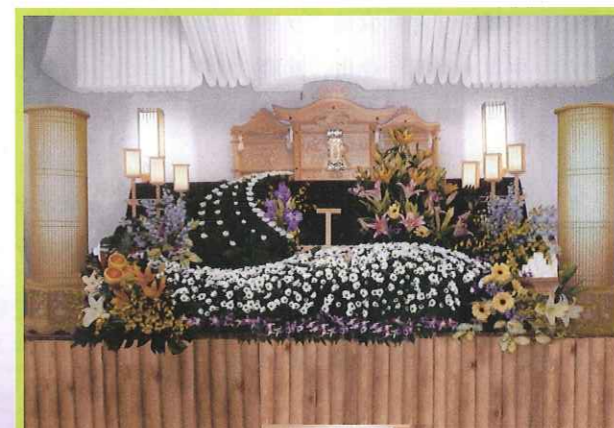
※写真の祭壇利用料金は12万円(初七日まで)で、花と果物と遺影は料金に含まれません