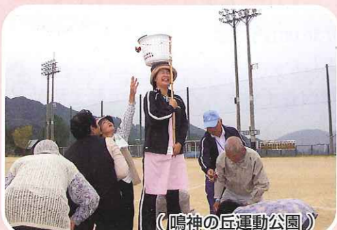
(鳴神の丘運動公園)