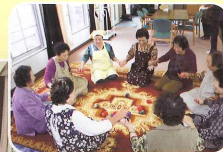
◀(小川島老人憩いの家)

10月23日(木)小川島老人憩いの家でいきいきサロンを行いました。ヘルスマイト(唐津市食生活改善推進協議会呼子地区)による栄養バランスの良い食事を頂き、食事後は簡単なゲームをして楽しみました。