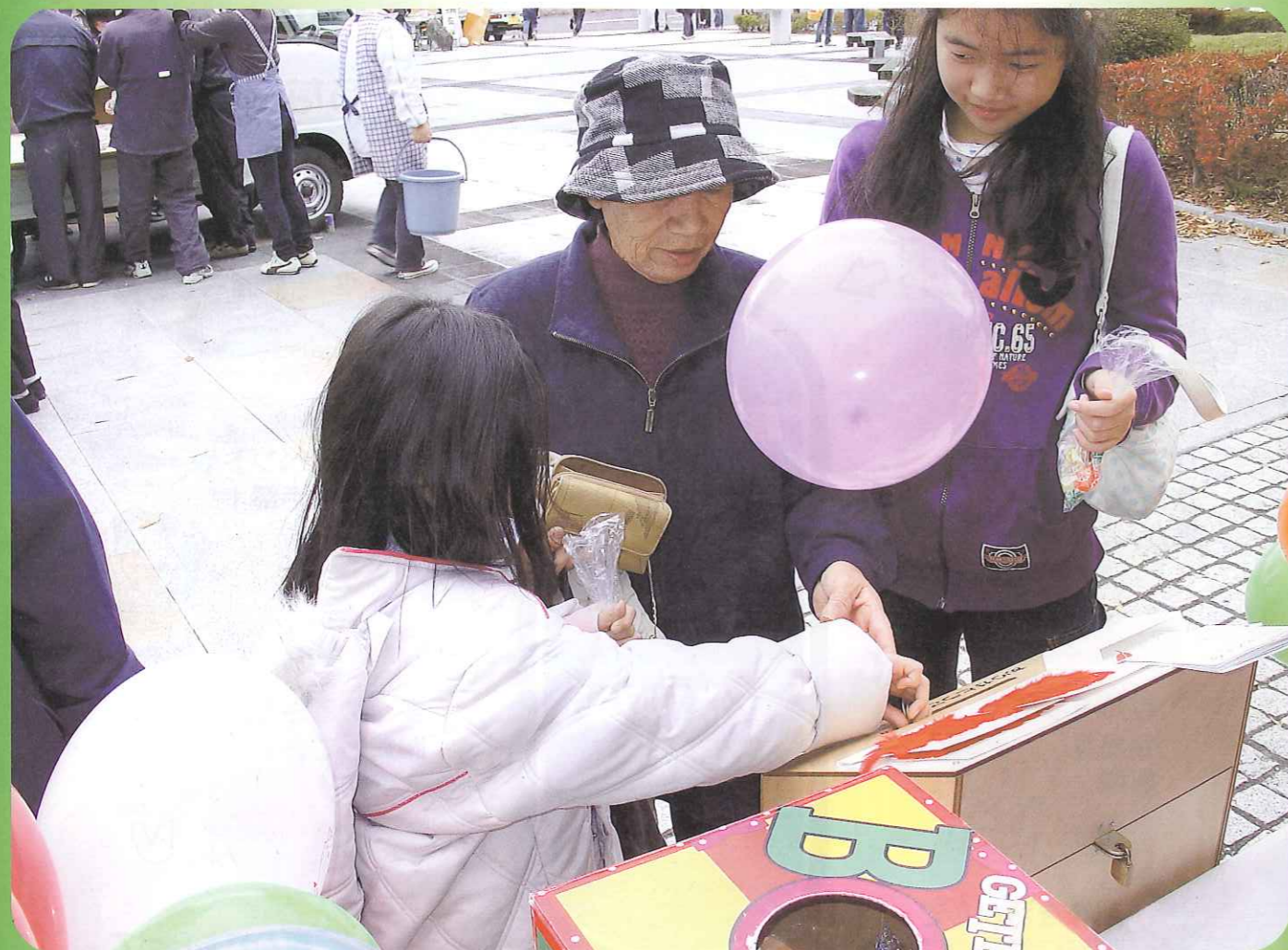
街頭募金のようす