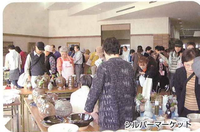
シルバーマーケット