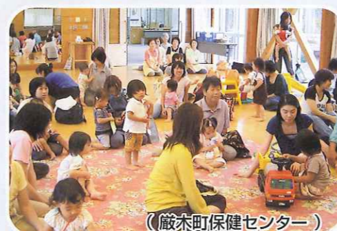
(厳木町保健センター)