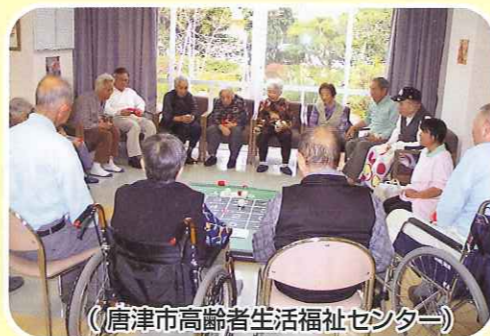
(唐津市高齢者生活福祉センター)