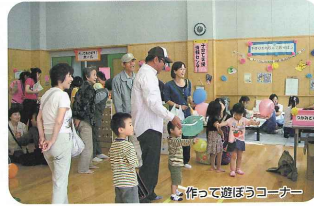
作って遊ぼうコーナー