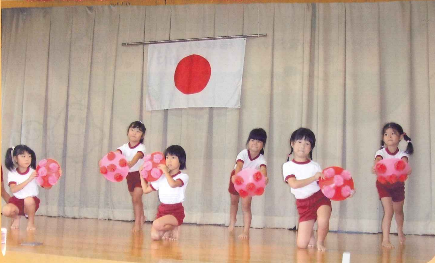
あけぼの保育園 園児さん