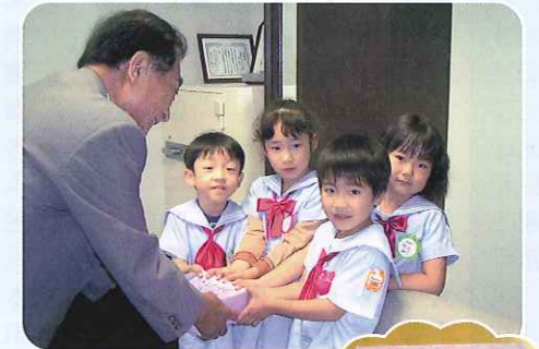
中国大地震寄付 (すみれ幼稚園)