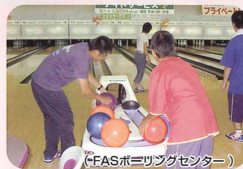
(FASボウリングセンター)

9月6日「子育てサロン」でボーリングに行きました。ストライクが出ると、大きな歓声が上がリ会話も弾みます。このサロンは知的障害者等の方とご家族、ボランティアとの交流を目的としています。他に足拭マットを作ったり、講演会、施設見学、クリスマス会、バス研修旅行等を予定しています。