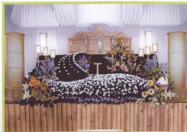
※写真の祭壇利用料金は12万円(初七日まで)で、花と果物と遺影は料金に含まれません