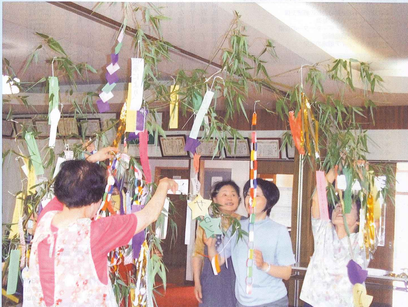
ニタ子 いきいきサロン