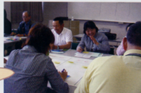
6班に分かれてのグループワーク

「自分の知らない災害前後の注意、準備などがよく理解できた。」 「改めてボランティアの大事さがわかった。」 「今後の励みになった。」・・・