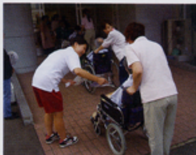
栄荘納涼祭での交流

－ ボランティア基礎講話・宅老(幼)所訪問・疑似体験・栄荘ボランティアを12名が体験しました。－