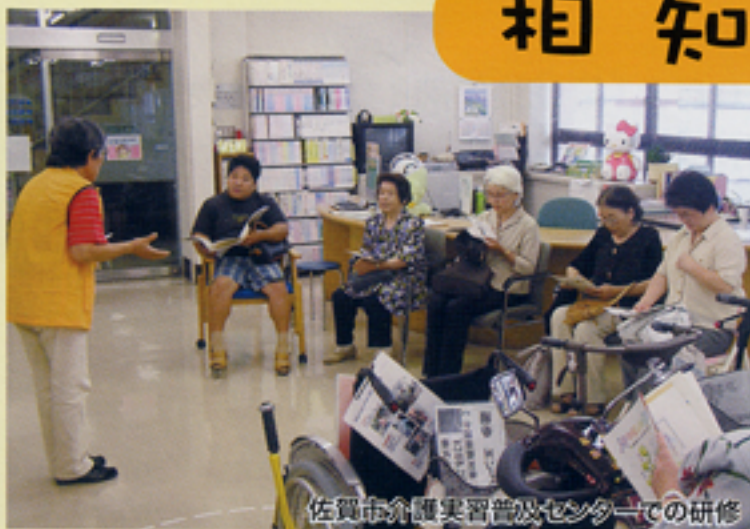
佐賀市介護実習普及センターでの研修