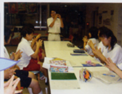
西方先生によるレクレーション・ワークショップ

・宅老所は、家族みたいで楽しかった。 ・はじめて体験キャンプに参加して、最初は何を話していいかわからず、うまく会話ができませんでした。少しずつですが高齢者の方に話かけられるようになりました。この体験キャンプで学んで私は将来の夢をしっかりと見つけることができました。 ・施設の方達にはあまりお手伝いをしてあげられなかったけど、「ありがとう。」「また来てね。」と言って笑顔を見せてくださったのが本当に嬉しかったです。