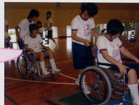
3年生が高齢者について学びました

相手のことを考えて、優しく、ゆっくりとした気持ちで心のケアをしていくのが大事だと思った。高齢になるにつれ、目が見えにくくなったり体が重くなったりして、体の自由が効かなくなるのは、とてもたいへんな事だと思った。