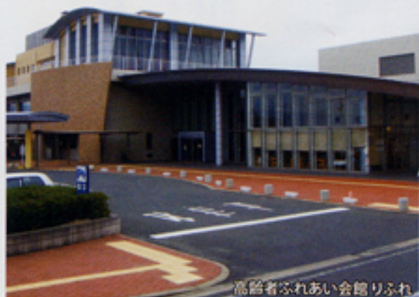
高齢者ふれあい会館リふれ